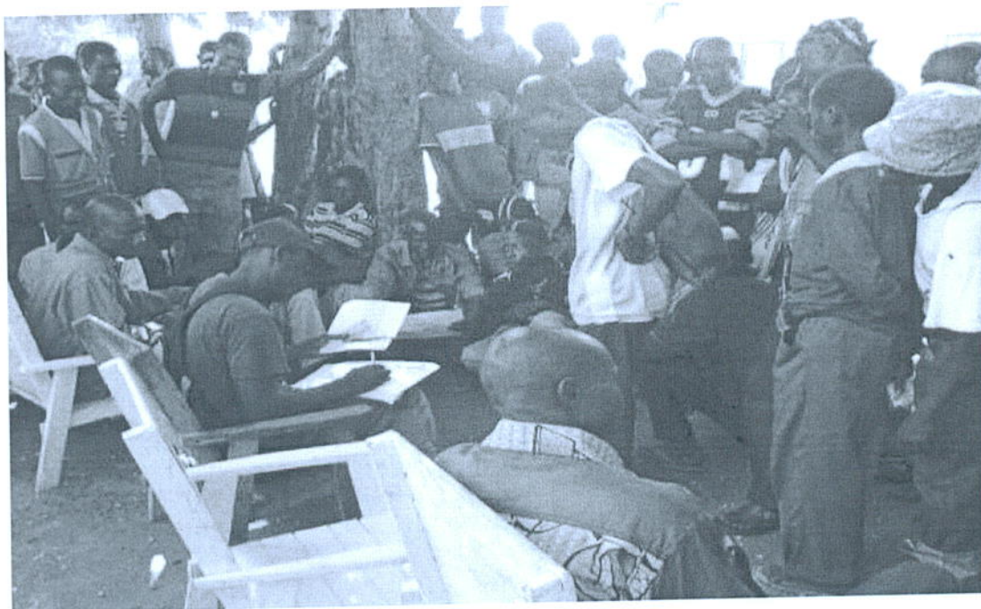
Photo1 : Ré-identification des démobilisés à Boguila

Chaque ex-combattant a reçu une somme de 21100Fcfca comme fond de soutien avant le lancement des activités de la réinsertion. Cette somme a été faite par la Coordination Nationale de la Réinsertion en présence du partenaire d'exécution qui est le JRS, le BINUCA, le PNUD, le CLDDR, le Ministère de DDR ainsi que le Ministère de la Communication.